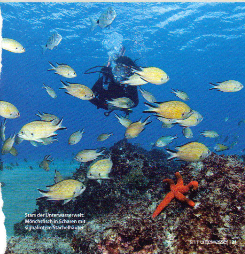
Stars der Unterwasserwelt: Mönchsfisch in Scharen mit signalrotem Stachelhäuter

MALEDIVEN ab/bis Male 7 Nächte Tauchsafari